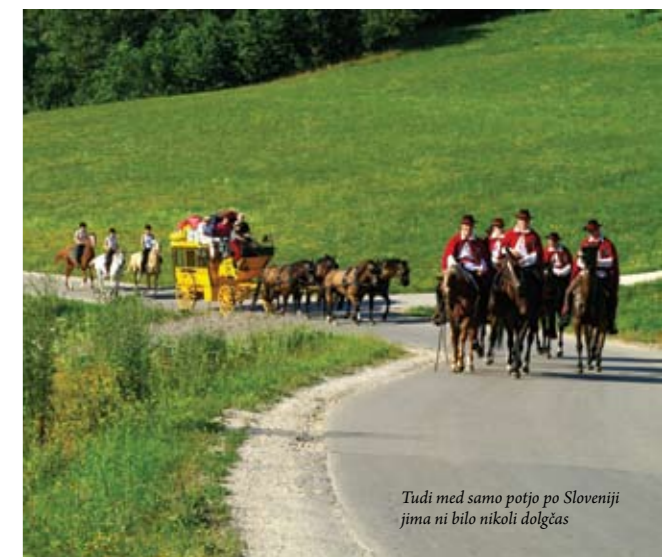
Tudi med samo potjo po Sloveniji jima ni bilo nikoli dolgčas

bi bilo npr. ,da rezervnega konja vzamemo sabo kot tovornega konja, vendar se za to nisva odločila, ker je to povezano z zelo visokimi stroški. Upava, da bomo vsi skupaj prišli srečno nazaj domov.«