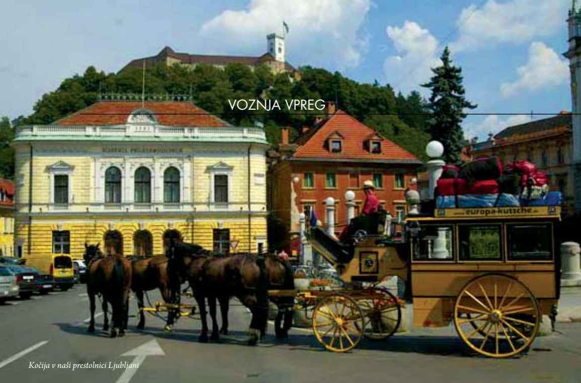
Kočija v naši prestolnici Ljubljani

nas je visoko na prelazih presenetil sneg, zdaj pa se potimo na vročem poletnem soncu – in seveda zaradi različnih zemljepisnih leg dežel, skozi katere potujeva. Konji bolj trpijo zaradi vročine, se bolj potijo, nadlega so muhe in mušice. Ni vedno prijetno, se pa navadimo tudi na to.«