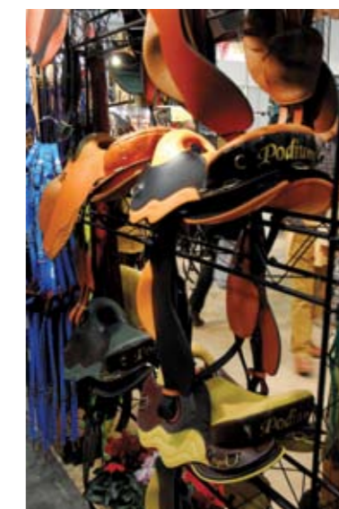
Najbolj razširjena znamka za endurance sedla Podium. Ta sedla so izredno lahka da ne obremenjujejo konja po nepotrebnem