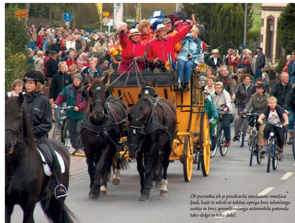
Ob povratku jih je pozdravila navdušena množica ljudi, kajti še nikoli ni takšna vprega brez tehničnega osebja in brez spremljevalnega avtomobila potovala tako dolgo in tako daleč